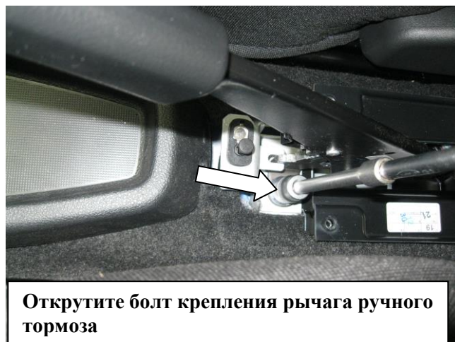
Открутите болт крепления рычага ручного тормоза