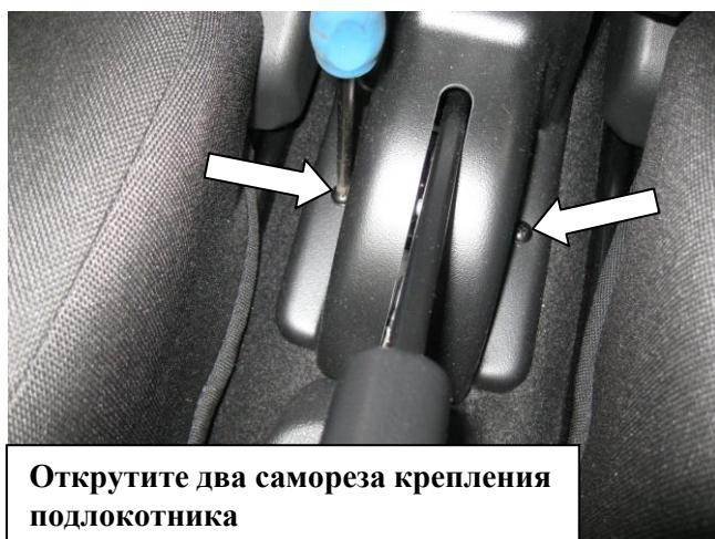
Открутите два самореза крепления подлокотника