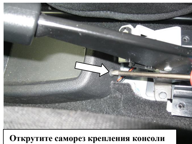
Открутите саморез крепления консоли