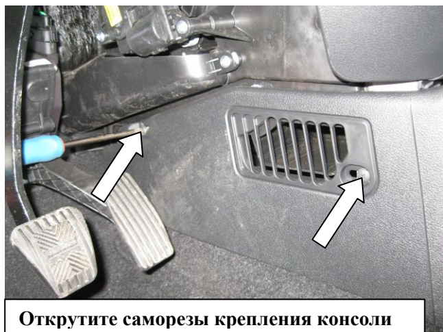
Открутите саморезы крепления консоли