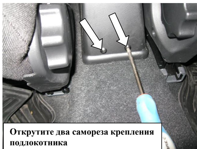
Открутите два самореза крепления подлокотника