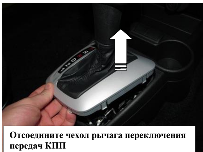
Отсоедините чехол рычага переключения передач КПП