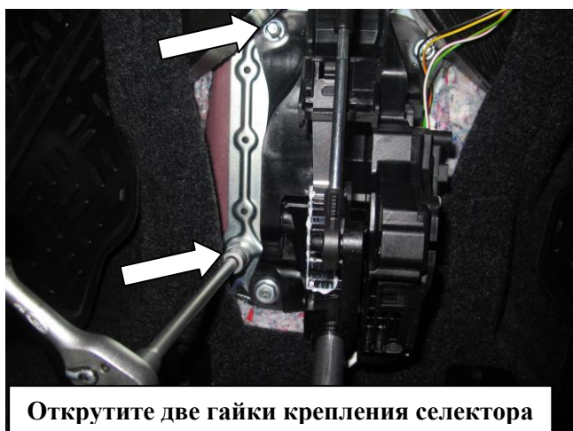
Открутите две гайки крепления селектора