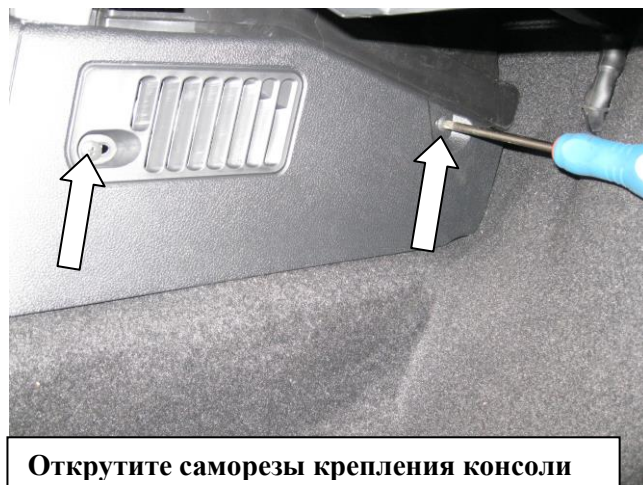
Открутите саморезы крепления консоли